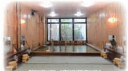
嬉野温泉「初音荘新館」