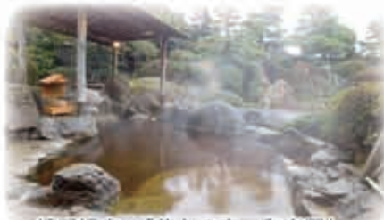
嬉野温泉「茶心の宿 和楽園」