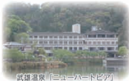
武雄温泉「ニューハートピア」