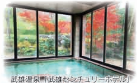
武雄温泉「武雄センチュリーホテル」