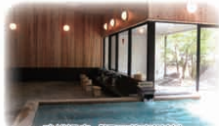
武雄温泉「湯元荘東洋館」